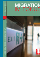
Migration im Fokus Dezember 2019: Abschiebung und Abschiebungshaft

In der Reihe „Migration im Fokus“, die die Reihe „Fluchtpunkte“ ersetzt, sind bereits erschienen: